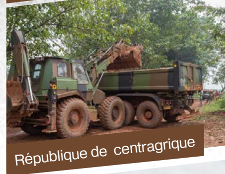
République de centragrique