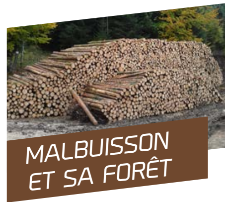
MALBUISSON ET SA FORÊT

Toutes nos félicitations et nous lui souhaitons une belle saison 2019-2020 pleine de réussite et de podiums.